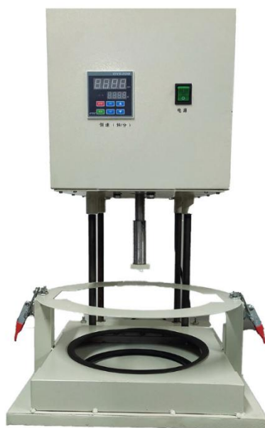
图 A.1 速度控制器