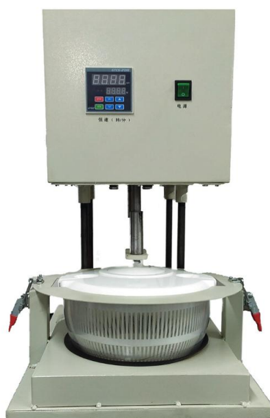
图 A.2 速度控制器与漂洗器的组合